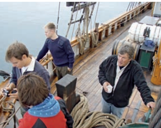
Bajen på fördäck.