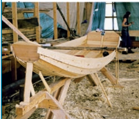
Ökbygge i Sjökvarterets skuthall

Under år 2009 kommer följande aktiviteter att arrangeras på Sjökvarteret: