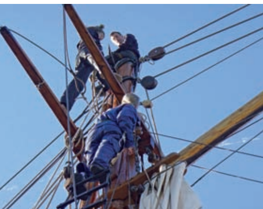
Stortoppmasten skall hissas.