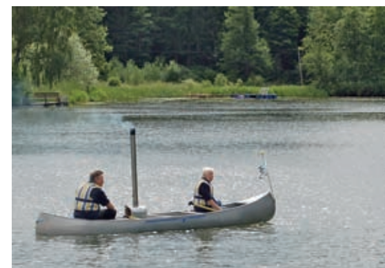
Kanalens dag med historiska fartyg.