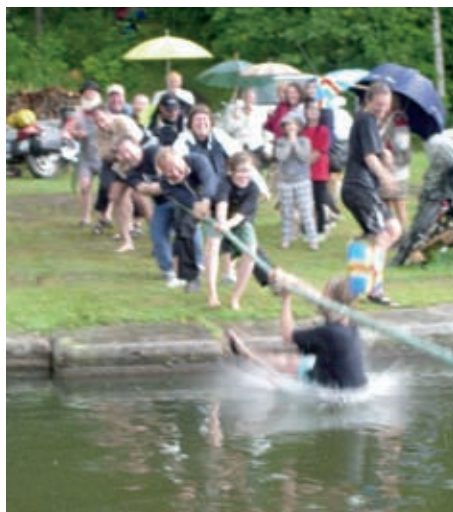
Blött i dragkampen i Hjälmare docka.