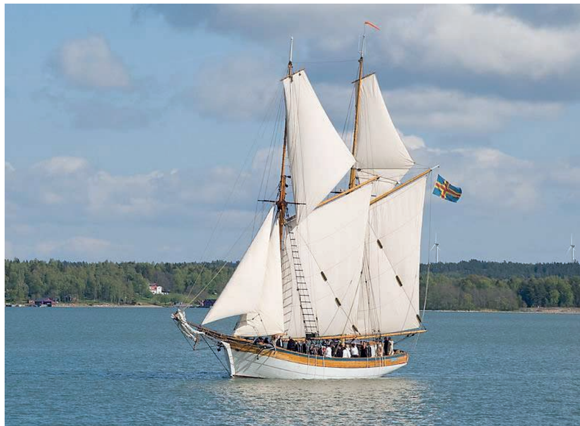
Albanus seglar på Slemmern.

Om man vill stödja föreningen går det naturligtvis bra att betala in även större summor!