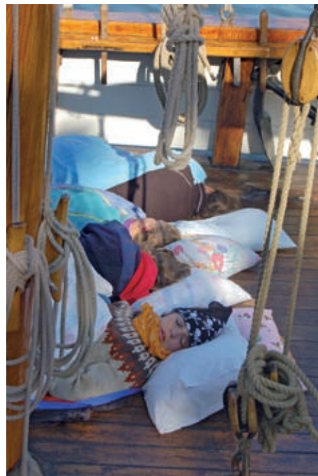
God sömn på däck.

vid badstranden alldeles bakom nästa udde och där var vattendjupet tillräckligt. Ryktet gick om att ett segelfartyg lagt till i norra hamnen och under kvällen vallfärdade öns hela befolkning till hamnen för att beskåda Albanus.