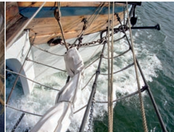
Slussning och segling.