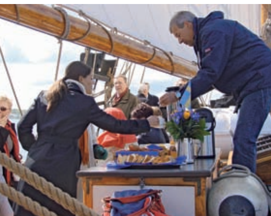
Kronprinsessan Victoria ombord på Albanus.