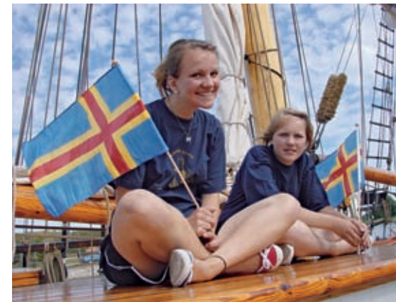
Åländskt på folkfest.

Så bar det i väg vidare, upp i den äldre delen av kanalen, den så kallade Bergskanalen. Denna del av kanalen är byggd på 1600-talet och grävd och sprängd genom bergig skogsmark. Bredden var på sina ställen inte mycket mer än att Albanus fick plats och de sprängda kanterna otäckt taggiga. Slussningarna går naturligt nog bara i en riktning åt gången, de enda mötet vi fick var en grupp kanotister som gapande och