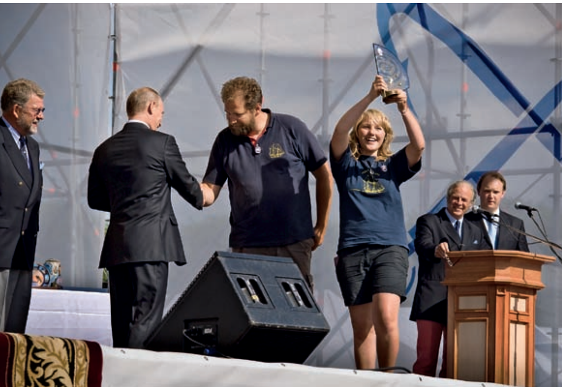
Elin, Tero, Putin och förstapriset.