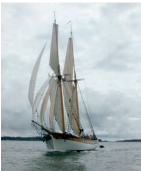
Albanus seglar mot Åbo i TSR.

"Albanus, Albanus, Albanus this is beachparty, beachparty, beachparty!"