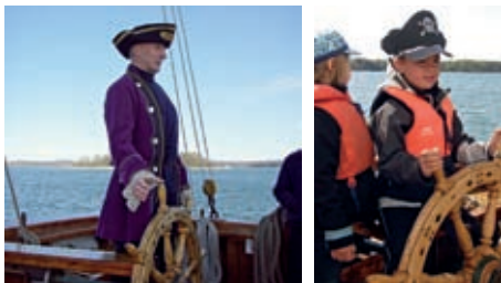
Pirater på Albanus.