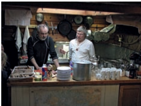
Morgonmål på medlemsseglingen.

gusti som var fullbokade. Vi är mycket glada för att Mariehamns stad och Ålands landskapsregering var med och finansierade detta äventyr. Ungdomarna hade själva bidragit via försäljningen i Jehu Huset 2008.