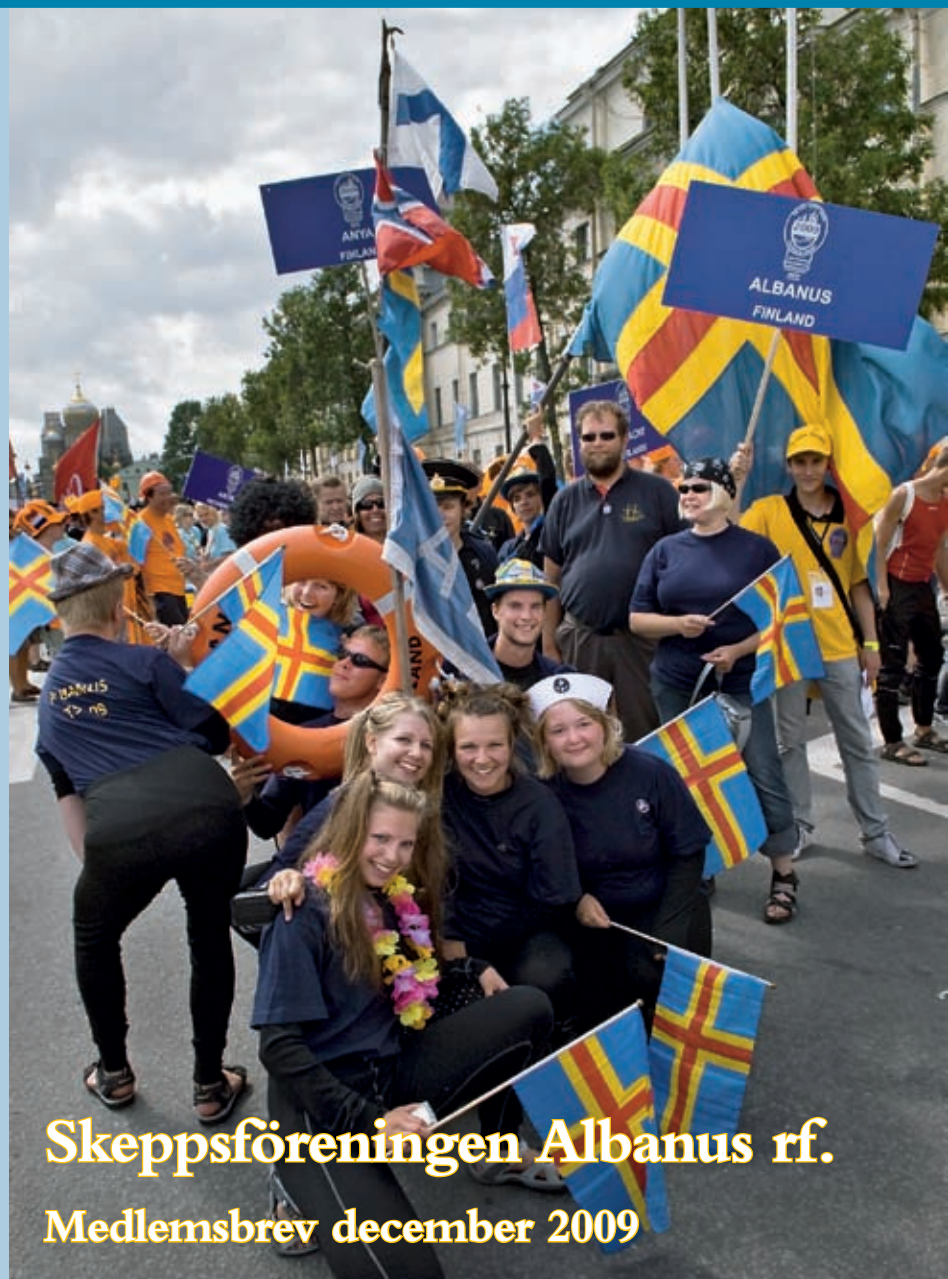
Skeppsföreningen Albanus rf. Medlemsbrev december 2009