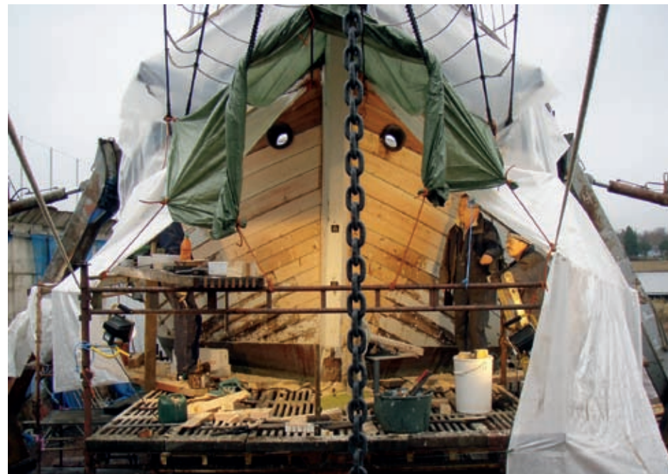
Slutgranskning på varvet.