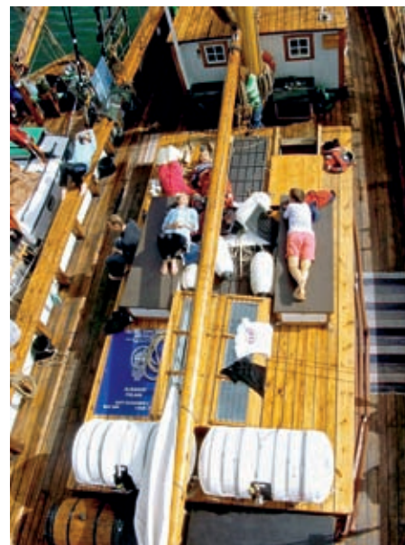
Besättningen solar.