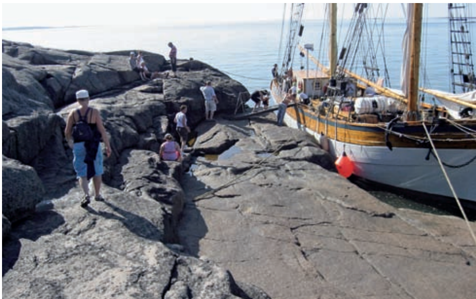
Albanus i Saggö naturhamn.